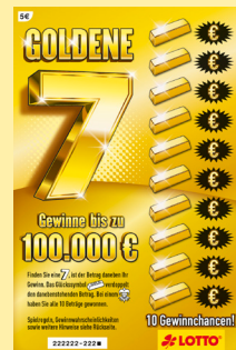
Lotterie 20-237 : Abb. beispielhaft